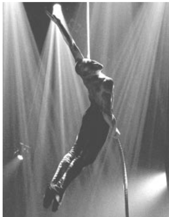
Excentricus du Cirque Éloïze

Les dates d'inscription pour les demandes de bourses aux artistes professionnels sont le 17 avril et le 10 septembre 2001. Les dates d'inscription pour les