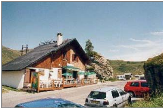
Refuge du Plan de la Lai