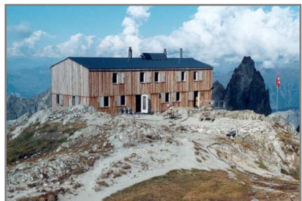
Refuge de Saleina (Suisse)