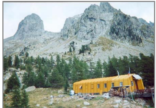
Refuge de la Cougourde