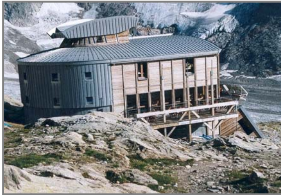
Refuge des Conscrits