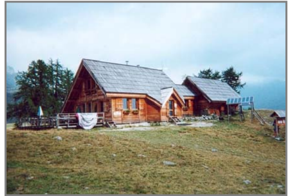
Refuge du Chardonnet