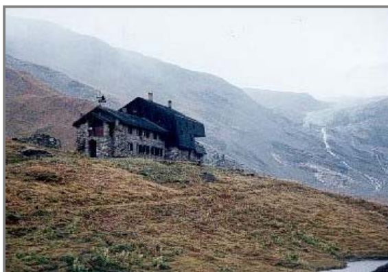
Refuge Mario Bezzi (Italie)