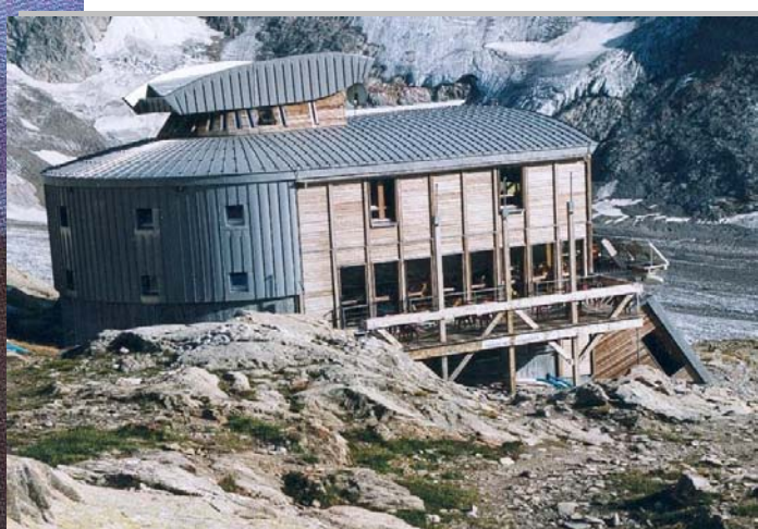
Refuge des Conscrits