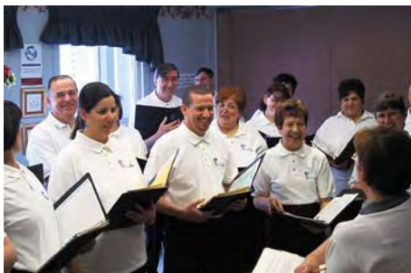
Photo : Le chœur Le Carillon

Le chant choral occupe une grande place dans les loisirs culturels des Repentignaises et des Repentignois