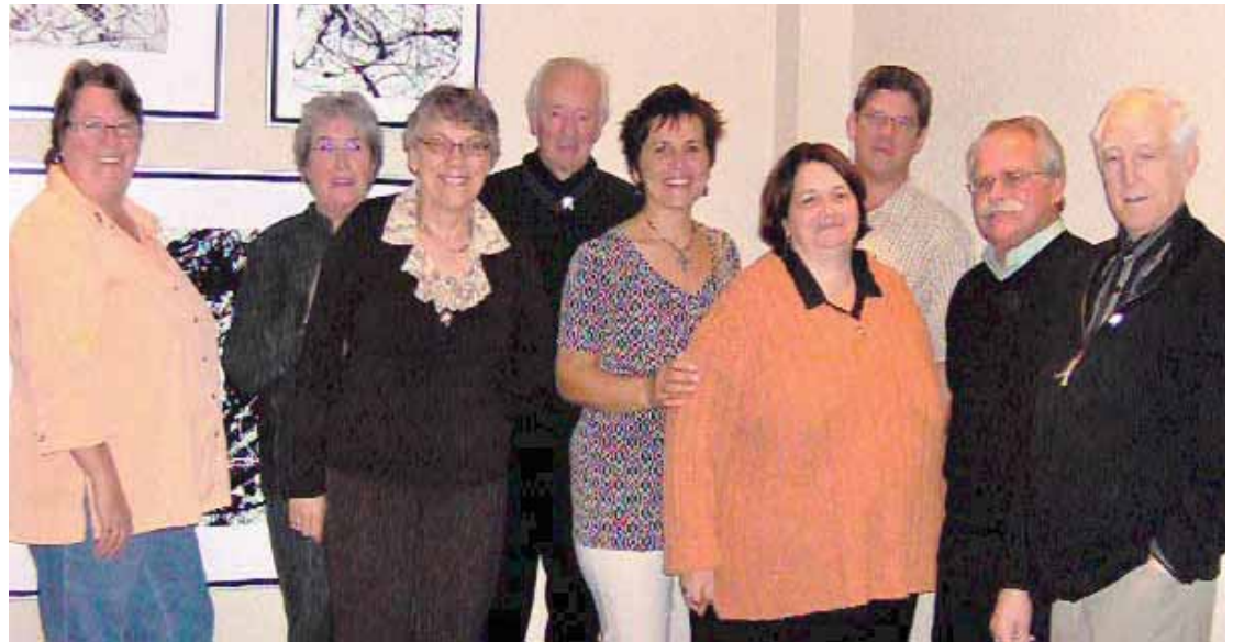
Le conseil d'administration actuel en lac-à-l'épaule à Québec, en octobre dernier.