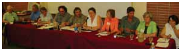
Le conseil d'administration de la FCABQ s'adresse à l'assemblée générale.