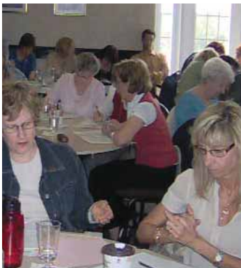
Journée de ressourcement et de formation pour les bénévoles engagés auprès des aînés à Shawinigan, au mois d'avril dernier.