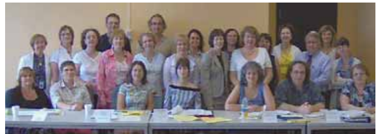
Les participants et les responsables du projet des Carrefours d'information pour aînés lors de la rencontre d'information aux organismes locaux, en juin 2007 à Montréal.

Le programme Engagés dans l'action pour les aînés du Québec vise à doter toutes les régions du Québec de carrefours d'information auprès desquels les aînés trouveront une multitude d'informations gouvernementales sur des sujets qui les concernent. Ils seront un complément au Portail du Gouvernement du Québec. On espère également améliorer le maillage entre les ministères et les organismes à qui s'adressent ces programmes.