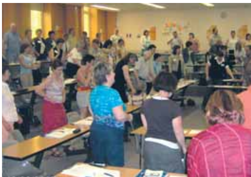
Moment de lâcher-prise collectif au cours de la conférence d'ouverture.