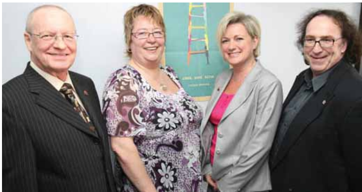
Le Centre de Bénévolat de Saint-Hyacinthe a accueilli le déploiement de la Semaine de l'action bénévole 2008.

L'équipe du Centre de Bénévolat de Saint-Hyacinthe