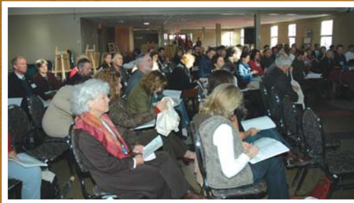
États Généraux de la Culture dans Vaudreuil-Soulanges, 22 octobre 2005. Édifice Paul Brasseur, Rigaud.

L'une des étapes importantes de ces démarches a été de préparer la tenue des « États Généraux de la culture dans Vaudreuil-Soulanges ». Plus de 85 participants, artistes, élus municipaux et intervenants culturels régionaux s'y sont donné rendez-vous afin de constater la situation culturelle dans la région de Vaudreuil-Soulanges et de témoigner de leur vision d'avenir, et ce, sous l'angle de plusieurs thèmes, à savoir le patrimoine, l'histoire, les arts visuels, les arts de la scène et leur diffusion, l'artisanat et les métiers d'art, les bibliothèques et la place de la culture dans le monde scolaire.