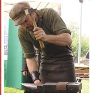
Ferronnier d'art, Les Seigneuries 2006, Musée régional de Vaudreuil-Soulanges.