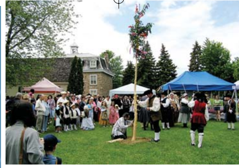
La plantation du mai dans le cadre des Seigneuriales 2006 au musée régional de Vaudreuil-Soulanges.