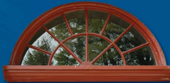
Détail d'architecture de la fenestration de l'église Saint-Michel de Vaudreuil (Vaudreuil-Dorion); construite de 1783 à 1787, agrandie en 1856, classée monument historique en 1957.