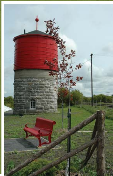
Château d'eau du Canadien Pacifique (Saint-Télesphore), construit en 1902.