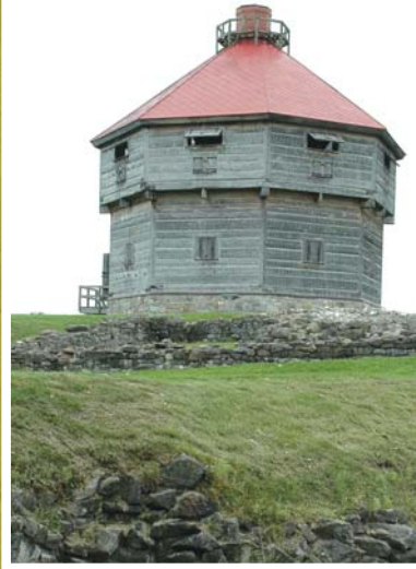
Lieu historique national de Coteau-du-Lac Ouvrages de transport fluvial et de défense; 1781 et 1812; désigné Lieu historique national en 1923.