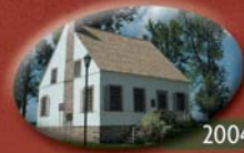
Maison Valois (Vaudreuil-Dorion): construite en 1796, classée monument historique en 1972.

Sous le régime britannique et à la suite de la guerre d'Indépendance des États-Unis, la convergence d'un ensemble de facteurs sociaux fait en sorte que la tenure seigneuriale des terres est remise en question. Ainsi, c'est en 1854 que survient l'abolition du régime seigneurial, lequel est alors remplacé par des administrations municipales et régionales. La majorité des 23 municipalités actuelles de la MRC de Vaudreuil-Soulanges sont alors fondées à partir des limites des paroisses religieuses. L'agriculture mixte, dans laquelle les cultures céréalières et herbagères dominant, représente alors le plus important secteur d'activité économique de la région et l'un des principaux facteurs de rétention des populations.