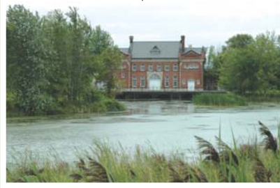
Ancienne centrale électrique du canal de Soulanges (Les Cèdres); construite en 1904; classée monument historique en 1984.

En ce qui a trait à l'écriture, à la diffusion d'œuvres littéraires régionales et aux métiers du livre, ce sont là des secteurs qui suscitent un engouement renouvelé. De plus, les 20 bibliothèques de la MRC de Vaudreuil-Soulanges constituent autant de pôles permettant aux citoyens de tous âges, de vivre des activités quotidiennes de lecture, de détente, d'apprentissage et d'information.