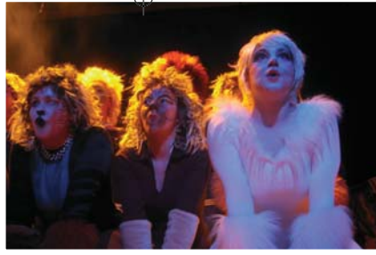
Représentation de la pièce «Cats».