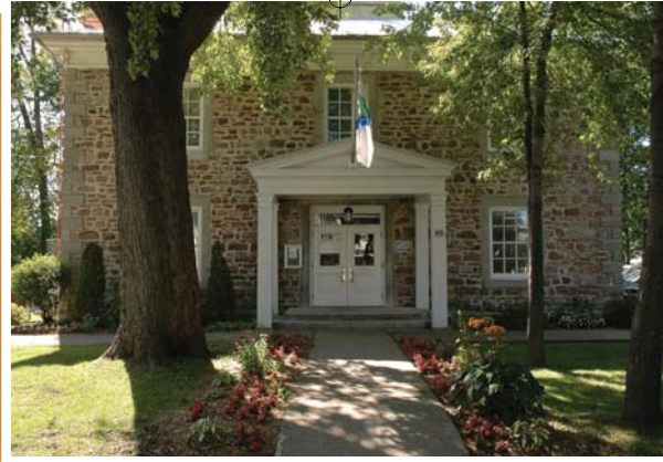
Siège social de la MRC de Vaudreuil-Soulanges, construit en 1859.