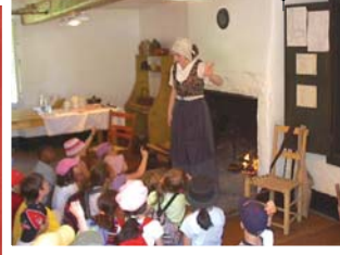
Animation au Parc historique de la Pointe-du-Moulin (été 2006).

En 1899, l'inauguration du canal de Soulanges marque profondément le paysage de Pointe-des-Cascades jusqu'à Coteau-Landing, favorisant du même coup les échanges commerciaux et le développement démographique et économique, en particulier des villages de la rive sud. Considéré aujourd'hui comme étant un fleuron patrimonial de l'ingénierie maritime, le canal de Soulanges était alors l'ouvrage maritime canadien le plus moderne de l'époque grâce à des techniques de construction d'avant-garde et à son électrification complète.