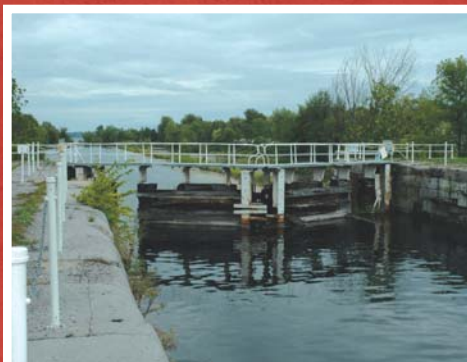
Écluses du canal de Soulanges (Pointe-des- Cascades), construit en 1899.

La situation géographique de Vaudreuil-Soulanges, en périphérie de Montréal, en fait un lieu de résidence fort prisé et est à l'origine, depuis plusieurs années, de l'accroissement et de la diversité de la population. Son histoire, ses attraits touristiques, son caractère tant rural qu'urbain, son ouverture et son dynamisme profitent à toute la communauté et aux citoyens attachés à la culture et au progrès.