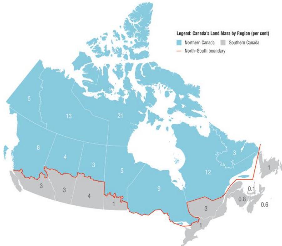
Figure 2. Le Nord du Canada