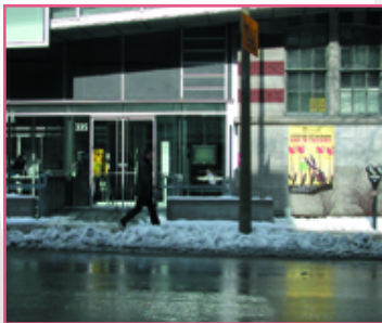
(La Cinéma québécoise)

À Montréal, la plupart des activités de la SACR se déroulaient à la Cinéma québécoise ( CQ dans le reste du document ). La salle d'exposition McLaren a été repensée de manière à pouvoir accueillir une centaine de personnes (débat et mises en lecture) et deux expositions. Les salles Fernand-Séguin et Claude-Jutras sont restées vouées au cinéma.