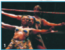
1 (Famille Zon) 2 [Peinture en direct]

Noctua, c'est la rencontre des musiques du monde et urbaine. Suite au succès de l'an passé, les Productions Monkey&Lion ont à nouveau concocté une petite nuit (mardi 19 mars - Nouveau Club