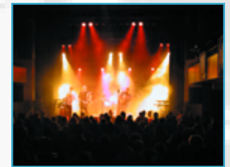
(Le public face à la scène)

True (Toronto), Dragon Fly, Me Kung Fu, Ironee (avec les musiciens de Stomp All Stars), KingFin, Planet Master, Kulcha Connection, Jahcutta and the Determination Band, DJ Universal Flexus se sont succédés sur la scène du Nouveau Club Soda le vendredi 22 mars. Chaud ambiance de dub poetry, ska, reggae et dancehall pour 650 amateurs enthousiastes.