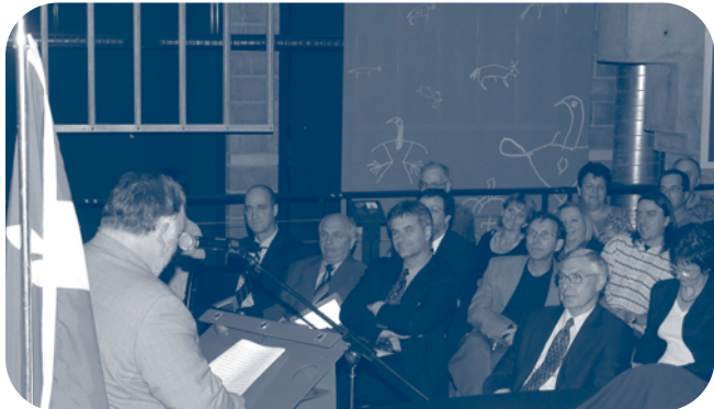
Assemblée générale annuelle du Conseil tenue le 6 octobre 2004 au Musée Pointe-à-Callière de Montréal.

Reconnaissant la mission du Conseil notamment à l'égard de favoriser la contribution du loisir dans le développement culturel, économique et social du Québec, le ministère de l'Éducation, du Loisir et du Sport verse au Conseil un soutien financier annuel qui lui permet de réaliser ses activités à l'effet de concerter les organismes de loisir, de former les bénévoles et les intervenants, de promouvoir le bénévolat en loisir, d'assurer la représentation du loisir et de ses intervenants aux plans canadien et international et de faire de la recherche et du développement.