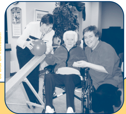
Fédération québécoise du loisir en institutum