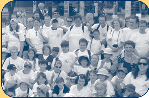
Cercle des jeunes naturalistes