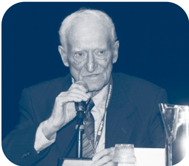
Le président d'honneur du Forum québécois du loisir 2003, M. Claude Ryan.