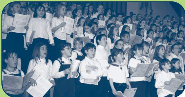
Aliance des chorales du Québec