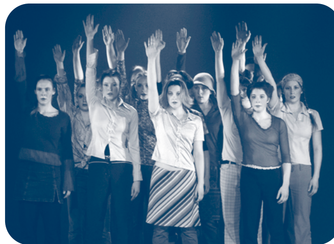
Réseau intercollégial des activités socioculturelles du Québec