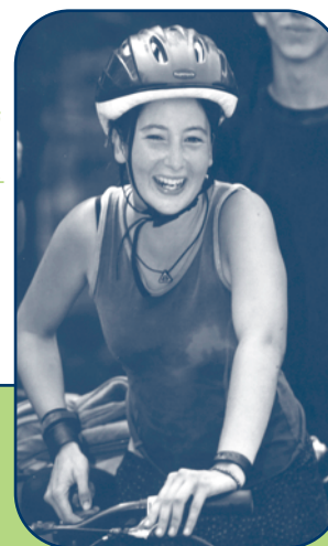
Association des camps du Québec