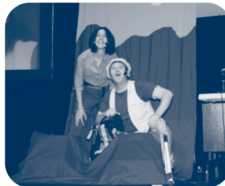
La troupe Mise au jeu a fait une intervention théâtrale fortement appréciée des participants.